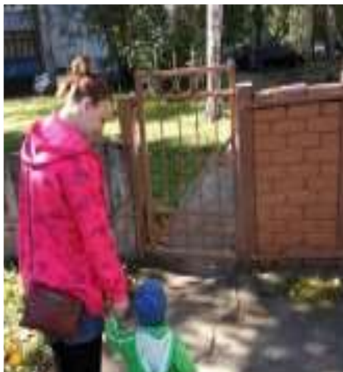
Акция "Возьми ребёнка за руку"