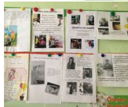
Выставка сочинений «Моя мама работает»