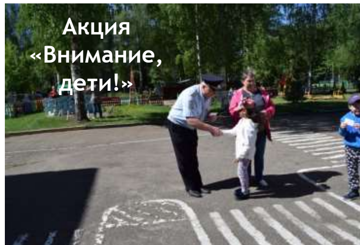
Акция «Внимание, дети!»