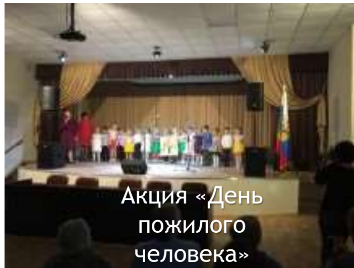
Акция «День пожилого человека»