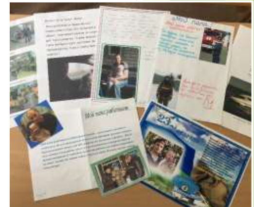
«Мой папа работает...»