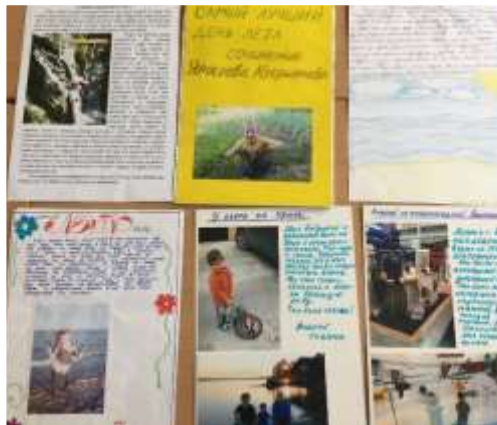
«Как я провел лето»