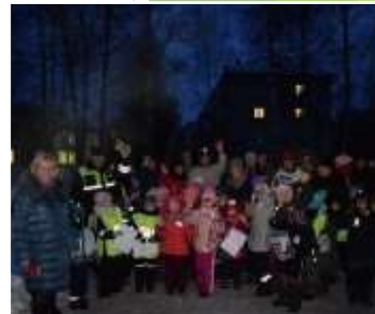
Квест-акция «Засветись светлячком»