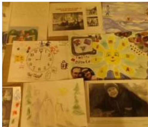
Выходной день в нашей семье