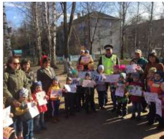
Акция «Рисунок водителю»