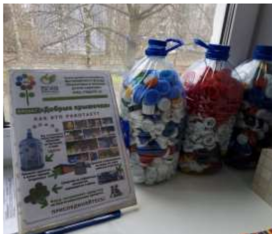
Акция «Добрые крышечки»