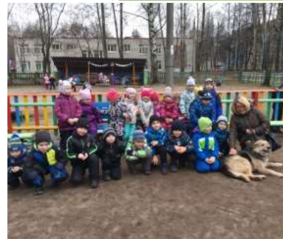
Благотворительная акция помощи бездомным животным