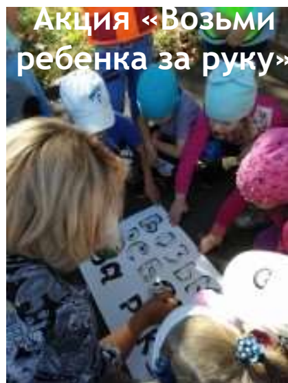
Акция «Возьми ребенка за руку»