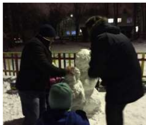
«Скульптуры на прогулочном участке»