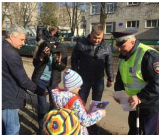
Акция «Родительский патруль»