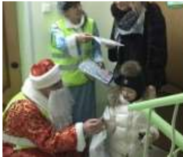
Акция «Полицейский Дед Мороз»